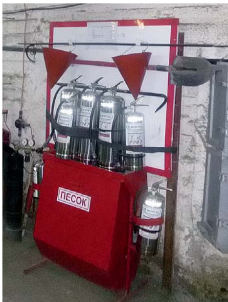
Переносные высокоэффективные воздушно-эмульсионные огнетушители BONTEL

В настоящее время на руднике «Таймырский» трудится более 1400 человек.