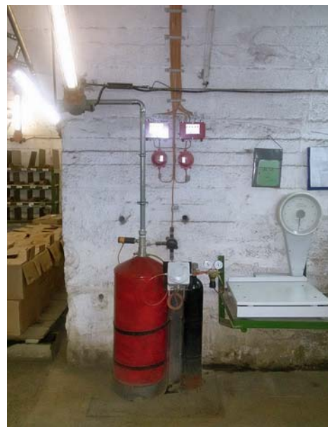
Подземный расходный склад ВМ и пункт изготовления ВВ оборудованные автоматическими (автономными) установками пожаротушения

Минусы: время непрерывной записи видеосигнала не более 12 ч и/или необходимость оборудования сети Wi-Fi в шахте.