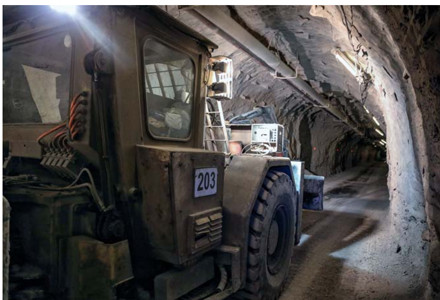
Видеорегистратор установленный на транспортных средствах

Плюсы: возможность контроля выполняемых работ на всех этапах – от получения ВМ до зарядки и монтажа ЭВС, вплоть до инициации зарядов, путем видеопросмотра записи или в режиме on-line (по средствам Wi-Fi).